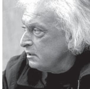
Гамлет Чипашвили — политолог, бывш. генеральный консул Грузии, бывш. парламентарий